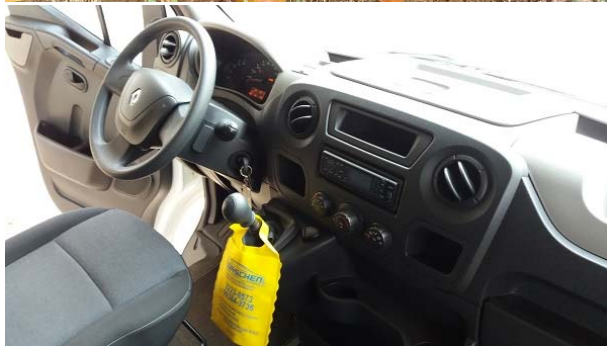
ANEXO 4 – RELATÓRIO DE AVALIAÇÃO DOS VEÍCULOS ELABORADO PELA COMISSÃO DE ALIENAÇÃO, DOC. SEI! N. (11180508).